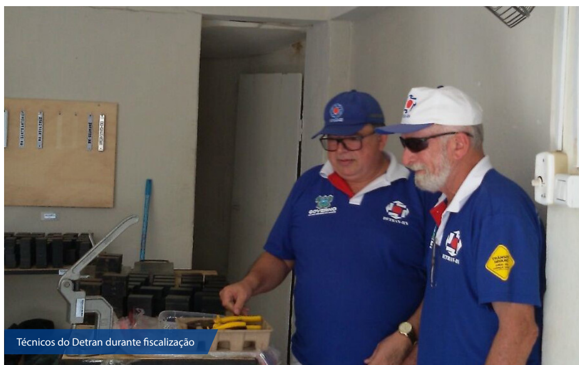
Técnicos do Detran durante fiscalização

O processo de fiscalização de fabricantes de placas e tarjetas do Estado é regulamentado pela Portaria 743/2008 do Detran. Nesse documento constam os procedimentos, as normas regulamentares e as sanções cabíveis numa eventual desobediência por parte dos fabricantes. O trabalho de fiscalização vai seguir, sendo realizado em todas as lojas credenciadas pelo Detran no RN.