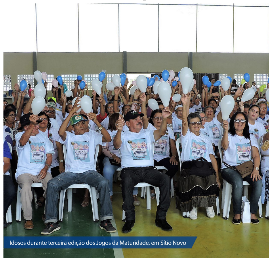
Idosos durante terceira edição dos Jogos da Maturidade, em Sítio Novo

A programação dos Jogos da Maturidade em Sítio Novo começou com o café da manhã servido no ginásio municipal de Serra da Tapuia, depois teve a abertura oficial com apresentação de teatro e música. Em seguida, todos partiram para a visita ao Castelo Zé dos Montes, na volta iniciou o campeonato de dominó, sueca e dama. Depois do almoço foi realizado o bingo e o concurso da mais bela voz e a tradicional disputa de dança.