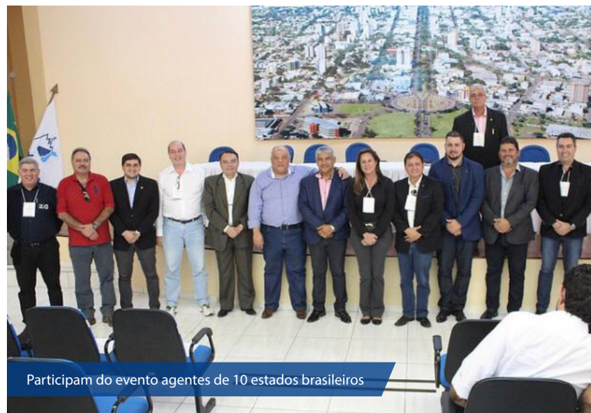
Participam do evento agentes de 10 estados brasileiros

A Portaria do Inmetro número 402, de 15 de agosto de 2013, estabeleceu requisitos para os medidores de umida-